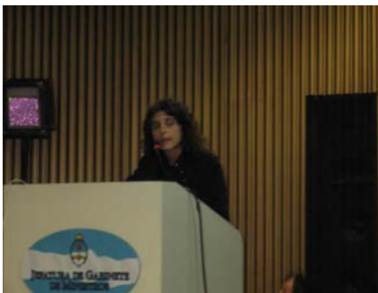
Secretária de Meio Ambiente e Desenvolvimento Sustentável da Argentina, Dra. Romina Picolotti durante o evento

Nos dias 21 a 23 de novembro 2007, ocorreu em Buenos Aires, Argentina, uma jornada de capacitação e treinamento em compras públicas sustentáveis oferecida pelo Marrakech Task Force (MTF) de Compras Públicas Sustentáveis especificamente para compradores argentinos. O MTF faz parte de um esforço global para atingir os objetivos estabelecidos durante a Cúpula Mundial sobre Desenvolvimento Sustentável em Johannesburgo, África do Sul em 2002. Representantes do Grupo de Trabalho do projeto participaram do treinamento como observadores com o objetivo de conhecer melhor o trabalho do MTF na Argentina, uma realidade mais próxima à brasileira. Entre os principais pontos positivos do treinamento, foram ressaltados pelos