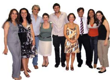
Representantes do Grupo de Trabalho do Projeto

Mudar os padrões de produção e consumo está no cerne das principais ações em prol do desenvolvimento sustentável. Uma das formas de se alcançar essa mudança é promover a introdução de critérios mais ambientalmente amigáveis nos processos de compras do setor público, as chamadas compras públicas sustentáveis. Para que isso comece a acontecer de uma maneira efetiva e imediata, o projeto “Fomentando Compras Públicas Sustentáveis no Brasil”, uma iniciativa da campanha global do ICLEI, Cidades pela Proteção do Clima (CCP), foi desenvolvido e sua fase inicial está sendo implementada nos estados de São Paulo e Minas Gerais e na cidade de São Paulo - os 3 maiores PIBs do Brasil depois da União - com o propósito de desenvolver um processo sistemático e uma estrutura estratégica para práticas de Compras Públicas Sustentáveis (CPS). A implementação de CPS por parte desses governos poderá influenciar o mercado, de forma a incentivar inovações e assegurar a introdução de produtos mais sustentáveis no mercado nacional.