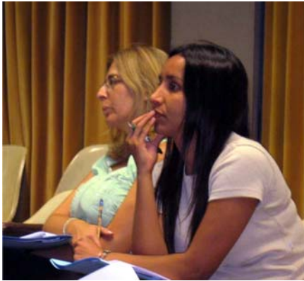
Representantes do Estado e Cidade de São Paulo durante o treinamento em Buenos Aires