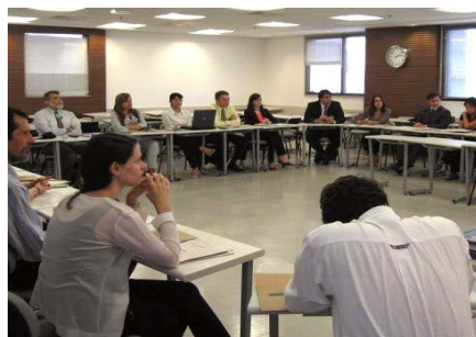
1ª reunião do Comitê Gestor e Conselho

O propósito do Comitê Gestor é envolver agentes de governo no debate sobre compras públicas sustentáveis e facilitar a integração do tema como política de governo, viabilizando sua implementação. O Conselho, que é composto por representantes da sociedade civil com reconhecida expertise no assunto, tais como representantes de ONGs, diversos níveis de governo, acadêmicos e instituições empresariais setoriais, é responsável por prover informações úteis e diretrizes sobre o tema para o Grupo de Trabalho e CG.