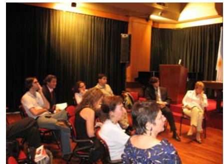
Participantes do colóquio